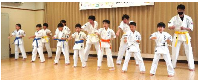
子どもたちの保護者も応援に