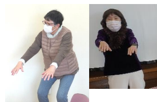
高部太極拳 + ハートクラブ庵原 合同の演舞