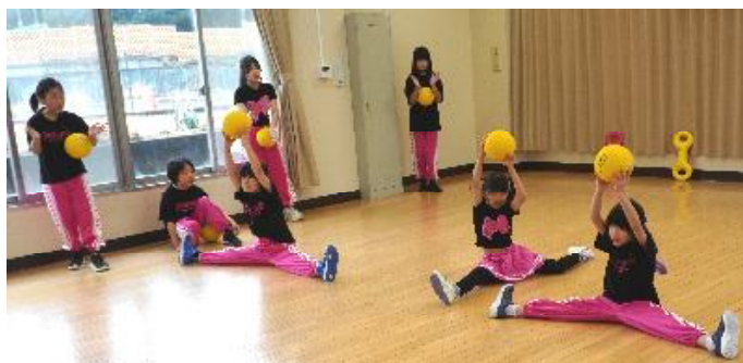
子どもたちの熱演に拍手喝采