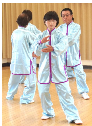
ハ ー ト ク ラ ブ 庵 原